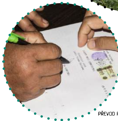
PŘEVOD POZEMKŮ U NOTÁŘKY.