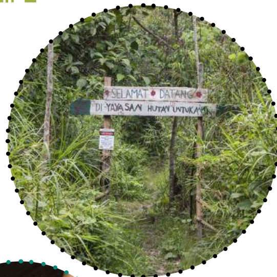
VSTUPNÍ BRÁNA DO REZERVACE II, TYGŘÍ BAŽINY.

Koncem roku 2015 má rezervace 50 ha chráněného území.