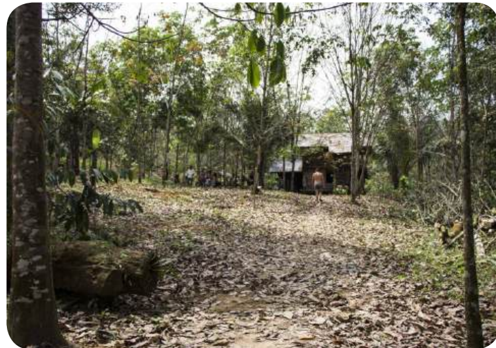
POZEMEK PRO VÝSTAVBU TYGRÍHO DOMU.