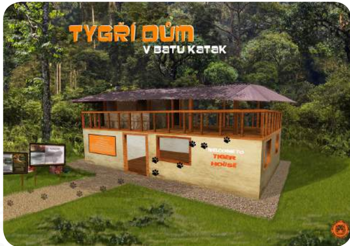
VIZUALIZACE, JAK BY MĚL TYGRÍ DŮM VYPADAT