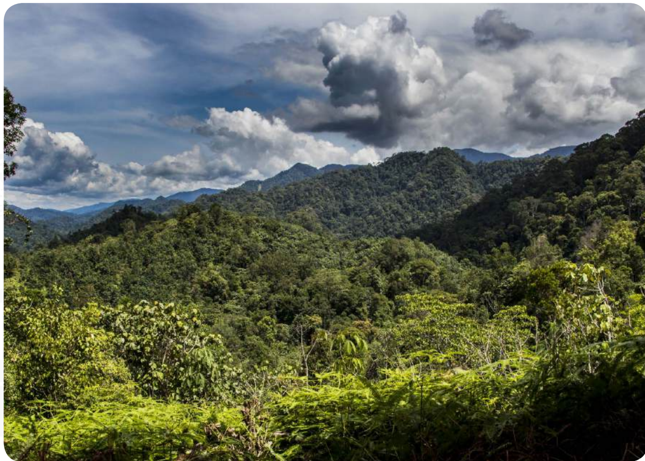
VÝHLED DO REZERVACE GREEN LIFE, V POZADÍ NP GUNUNG LEUSER.