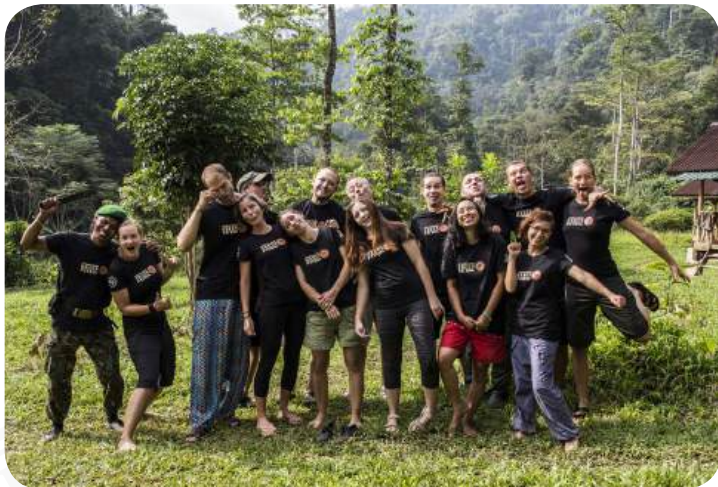
DOBROVOLNÍCI V REZERVACI GREEN LIFE, KEMP 2.