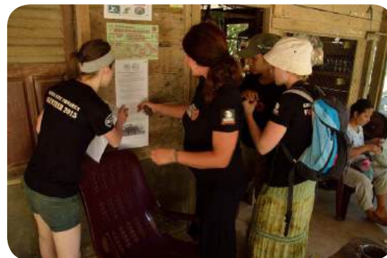
DOBROVOLNÍCI PŘI UMISŤOVÁNÍ INFORMAČNÍCH LETÁKŮ O KOMPENZACI ŠKOD ZPŮSOBENÝCH TYGREM.