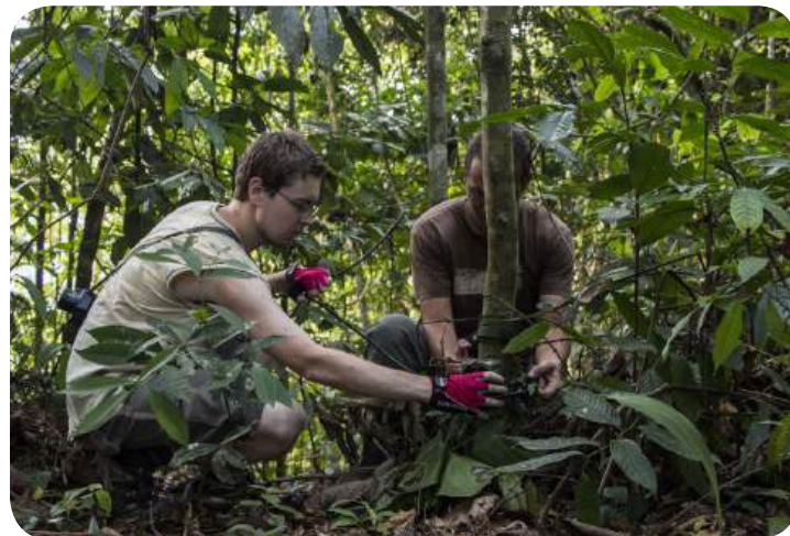
DOBROVOLNÍCI A PRÁCE S FOTOPASTMI