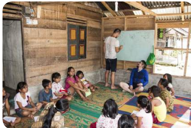
DOBROVOLNÍCI PŘI VÝUCE ANGLIČTINY