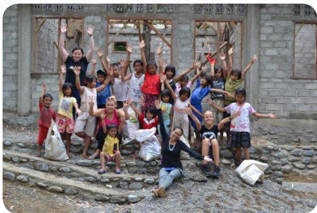
DĚTI Z BATU KATAK PŘI SBĚRU ODPADKŮ U STAVĚJÍCÍHO SE TYGŘÍHO DOMU

Vzdělávání dětí je mimořádně důležitý úkol ochrany přírody. V roce 2015 jsme pracovali prozatím v provizorních podmínkách ve vesnici Batu Katak a připravovali otevření reprezentativního vzdělávacího centra Tygří dům od ledna 2016.