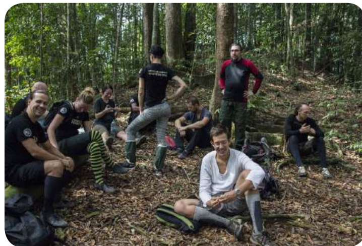
VÝPRAVA DO NP GUNUNG LEUSER - DOBROVOLNICKÁ HLÍDKA