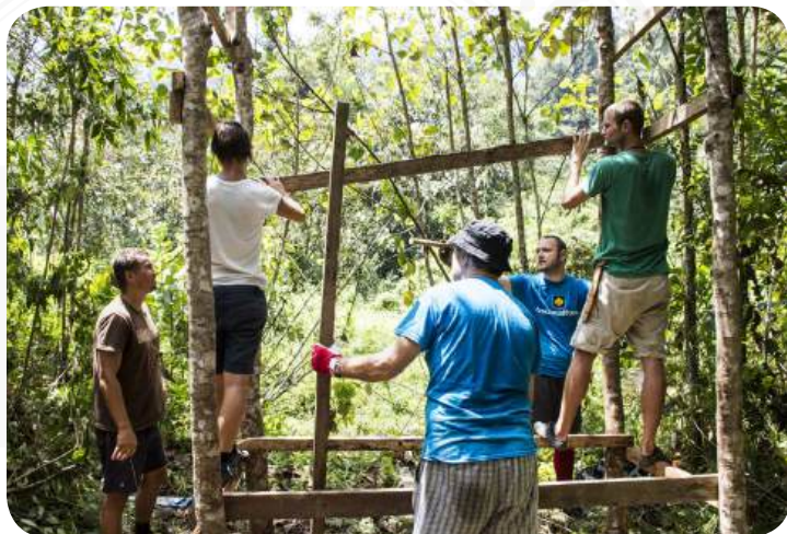
DOBROVOLNÍCI PŘI VÝSTAVBĚ POZOROVATELNY V TYGRÍCH BAŽINÁCH