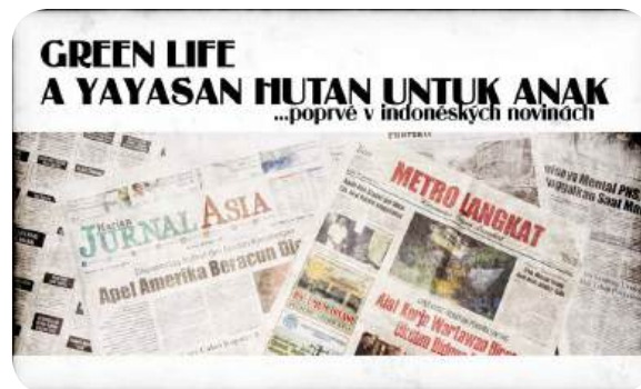
YHUA V INDONÉSKÝCH NOVINÁCH - KOMPENZACE ŠKOD TYGREM