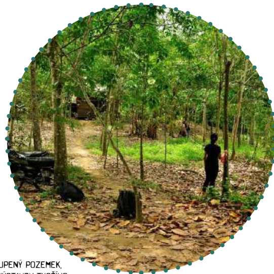
VYKOUPENÝ POZEMEK, PRO VÝSTAVBU TYGŘÍHO DOMU.

Plánované otevření Tygřího domu proběhne v lednu 2016.