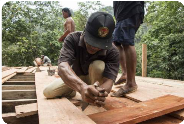
MÍSTNÍ INDONÉSKÝ DĚLNÍK PŘI PRÁCI NA TYGRÍM DOMĚ.