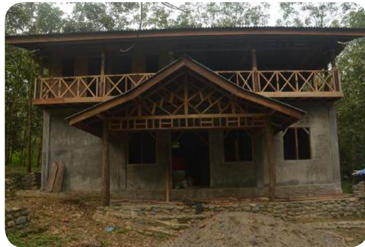
HRUBÁ STVÁBA TYGRÍHO DOMU.